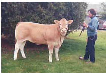
10 month old heifer - Sire: Eclair