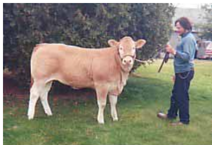
10 month old heifer - Sire: Eclair