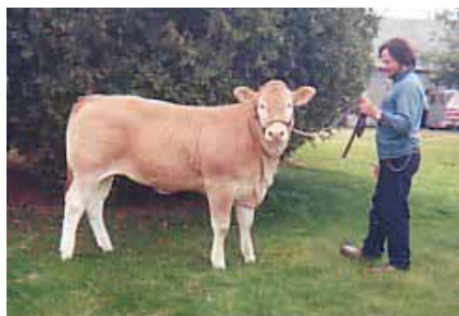
10 month old heifer - Sire: Eclair