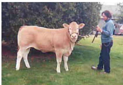
10 month old heifer - Sire: Eclair